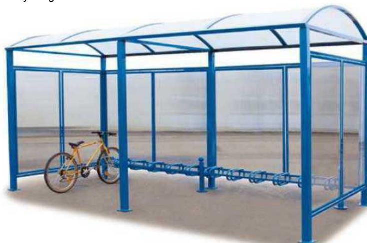
Zdjęcie wiaty moduł podstawowy + moduł dodatkowy, bez oszalowania bocznego

Konstrukcja składająca się z dwóch rurek aluminiowych 40 x 60 przymocowanych poprzez spójnienia ozdobne na słupkach oraz z dwóch rynien aluminiowych. Zadaszenie z przezroczystego poliwęglanu, 10 mm.