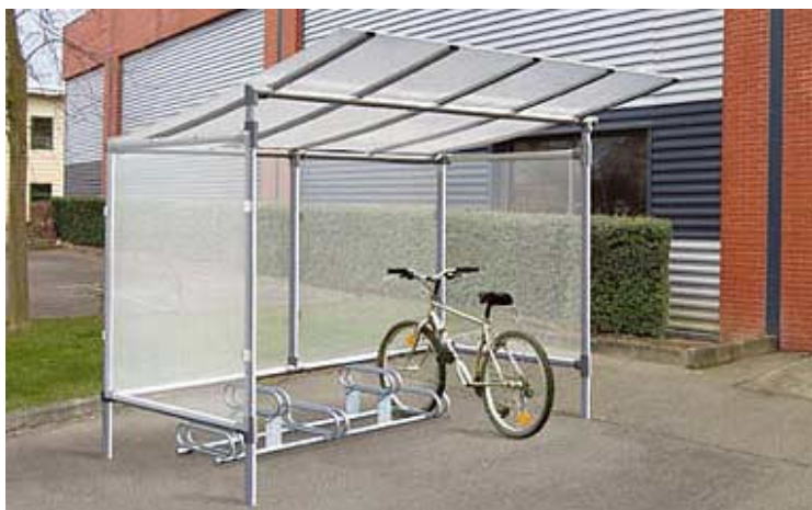
Wiata na 5 miejsc