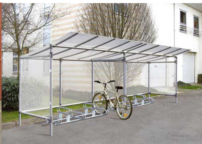
Wiata na 10 miejsc