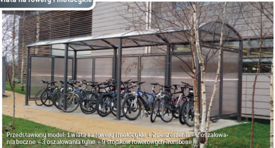
Przedstawiony model: 1 wiaty na rowery i motocykle + 2 poszerzenia + 2 oszalowania boczne + 3 oszalowania tylne + 9 stojaków rowerowych Trombone