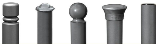
CITY AGORA KULA FORUM INOX GAŁKI WYKOŃCZENIOWE

10 LAT GWARANCJI NA ANTYKOROZYJNOŚĆ 5 LAT GWARANCJI PODSTAWOWEJ