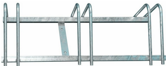
Opis: Moduł podstawowy 3 miejscowy