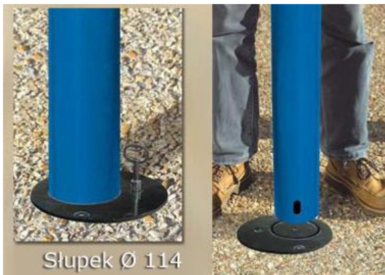
Słupek Ø 114