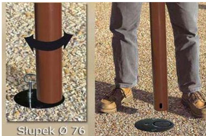
Słupek Ø 76

Proste utrzymanie : pojemnik pozwalający na akumulację piasku i kurzu, rozkładany.